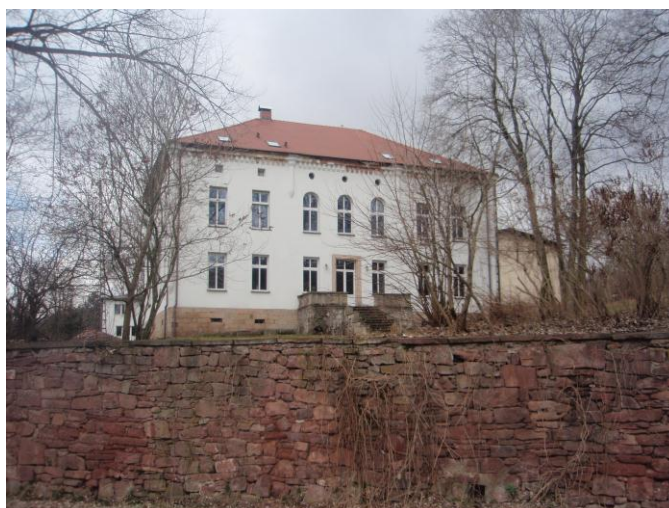
Fot. 1: Dwór Maria