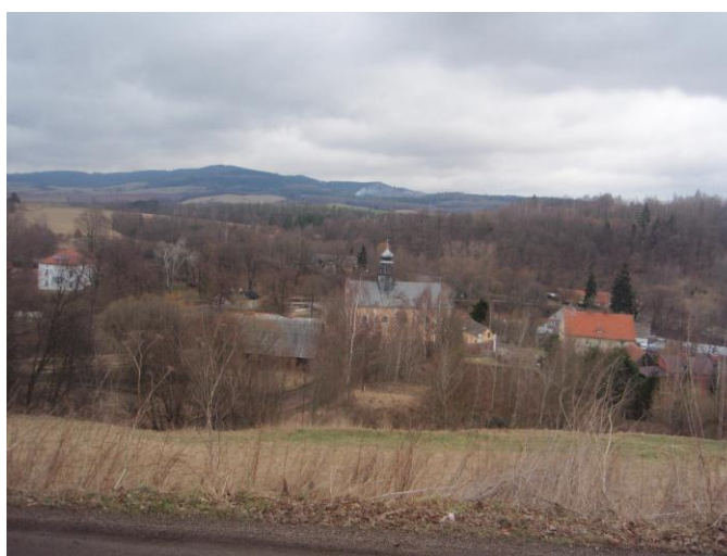
Fot. 3: widok na Tłumaczów