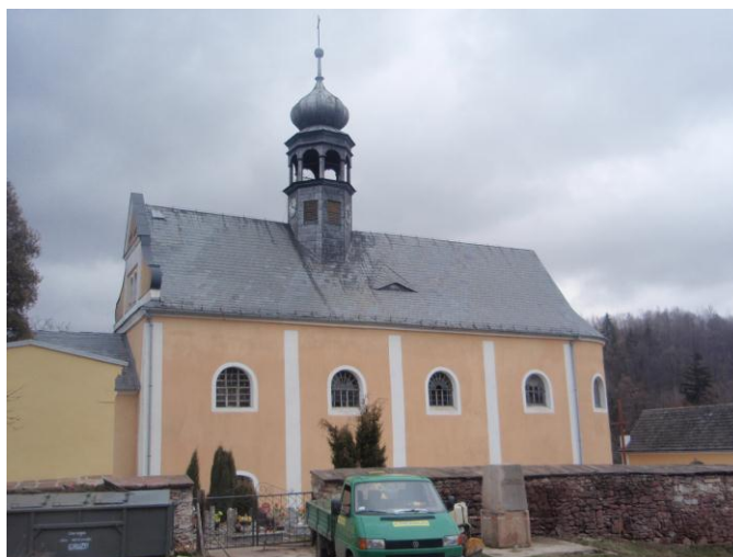
Fot. 2: Kościół filialny z XVII w.