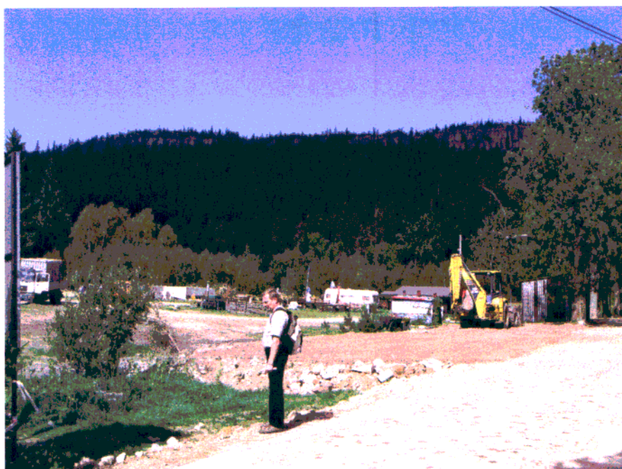
Fot. 3. Widok na północno-zachodni masyw Szczelińca w okolicach działki 69