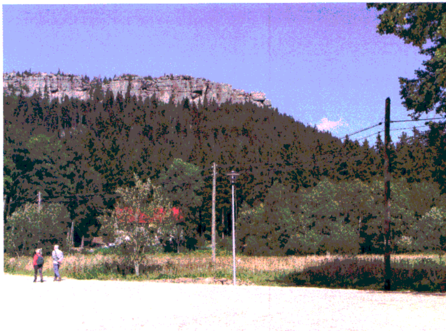
Fot. 2. Widok na Szczeliniec w okolicach działki 60/4