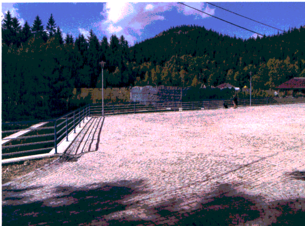
Fot. 1. Bruk z kostki granitowej, balustrady i oświetlenie dobrze wkomponują się w otaczający krajobraz.

Przeprowadzone w ostatnim czasie prace budowlane na terenie ciągu pieszo-jezdnego w Karłowie, będącego trasą turystyczną prowadzącą na Szczeliniec w znaczącym stopniu poprawiły wartość przestrzenną tego miejsca. Nowa nawierzchnia z kostki granitowej, mury oporowe rowu oraz infrastruktura techniczna w postaci latarni dobrze wkomponują się w otaczający krajobraz.