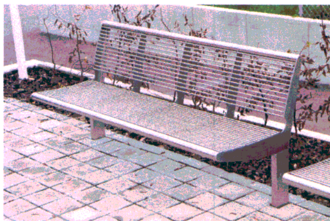
Fot. 11. Przykładowe umiejscowienie ławki.