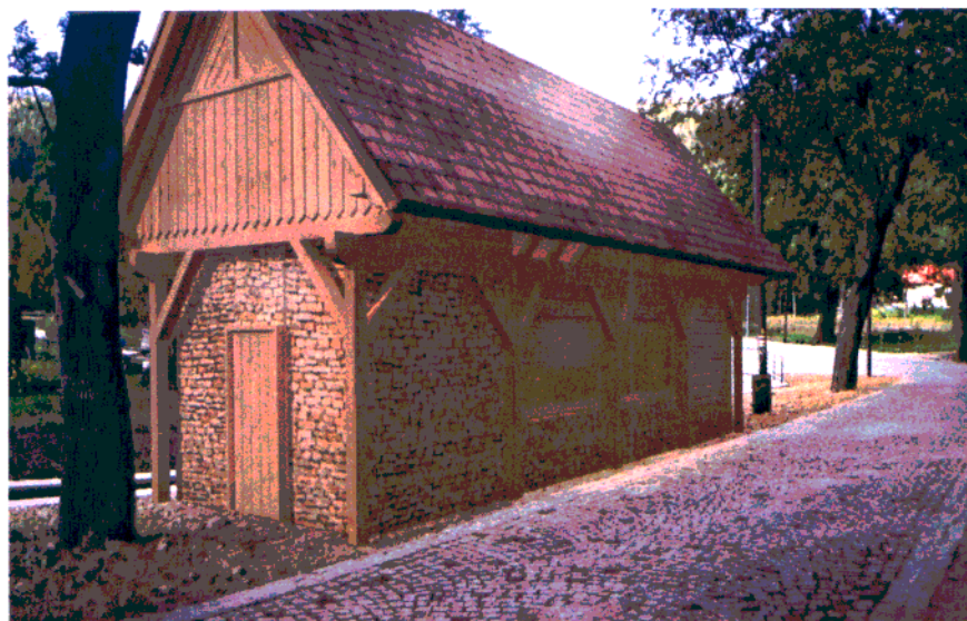
Fot. 9. Wizualizacja przykładowego rozwiązania projektowanej formy budynku dla tego miejsca.