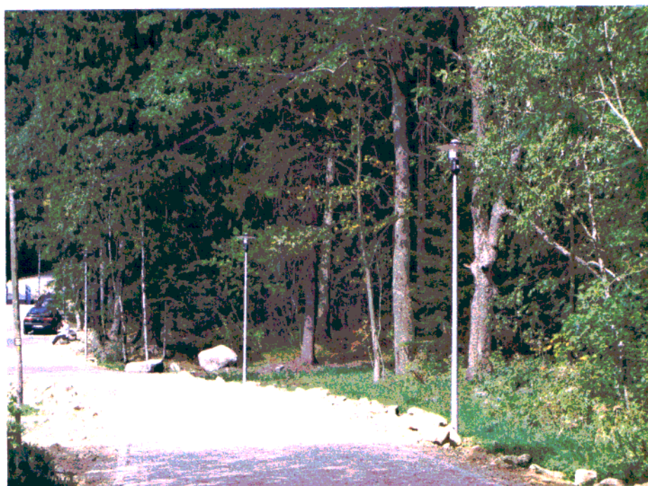
Fot. 7. Ściana wnętrza krajobrazowego w postaci zespołu zieleni na działce 60/1

Bezląd przestrzenny na opracowanym terenie powoduje przypadkowa zabudowa obiektów usługowych, o niewłaściwej formie (fot. 8), o zużytej i nie remontowanej substancji budowlanej, a również w treści nie odpowiadającej miejscu („farma” modeli dinozaurów).