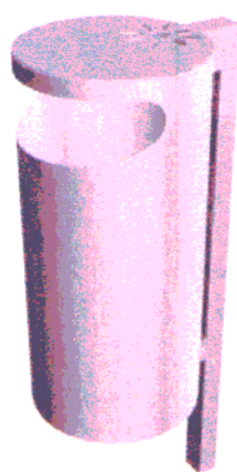
Fot. 11. Przykładowy kosz na odpadki stałe.

Źródło informacji na temat wybranej ławki i kosza: http://www.eko-park.com/opl.php?m=mpl&b=6&n=29&p=lawka_044 http://www.pmo.pl/