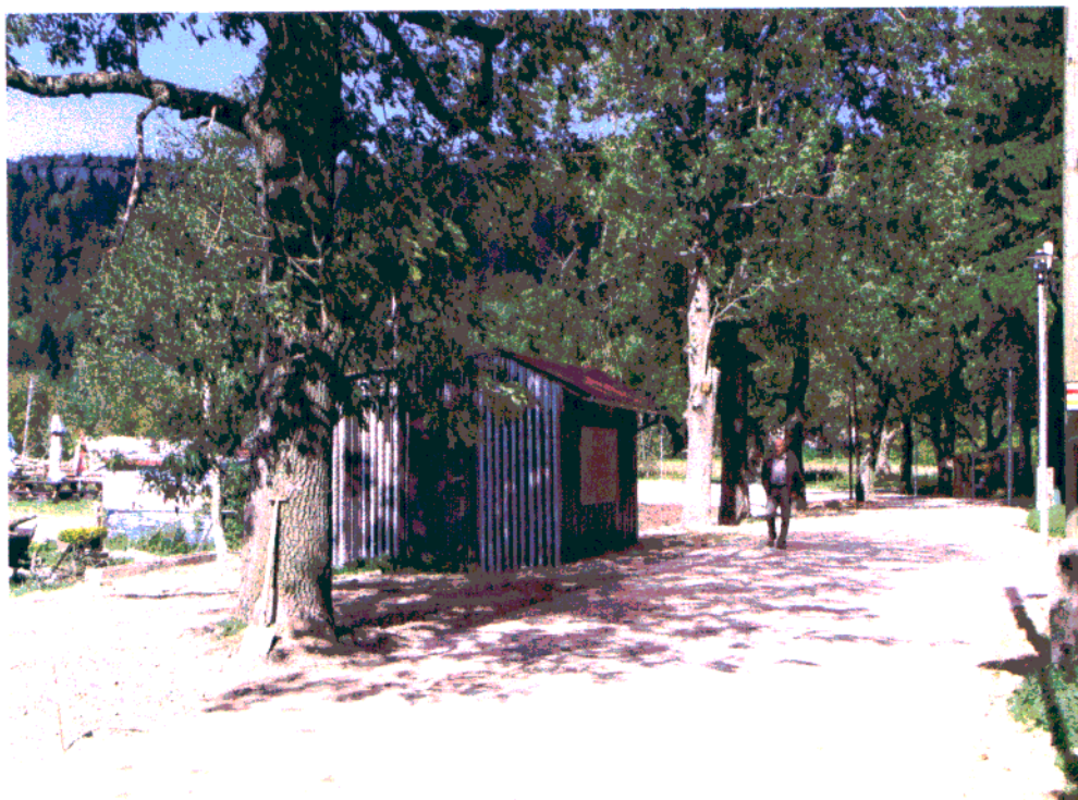
Fot. 8. Niewłaściwa forma obiektów usługowych.