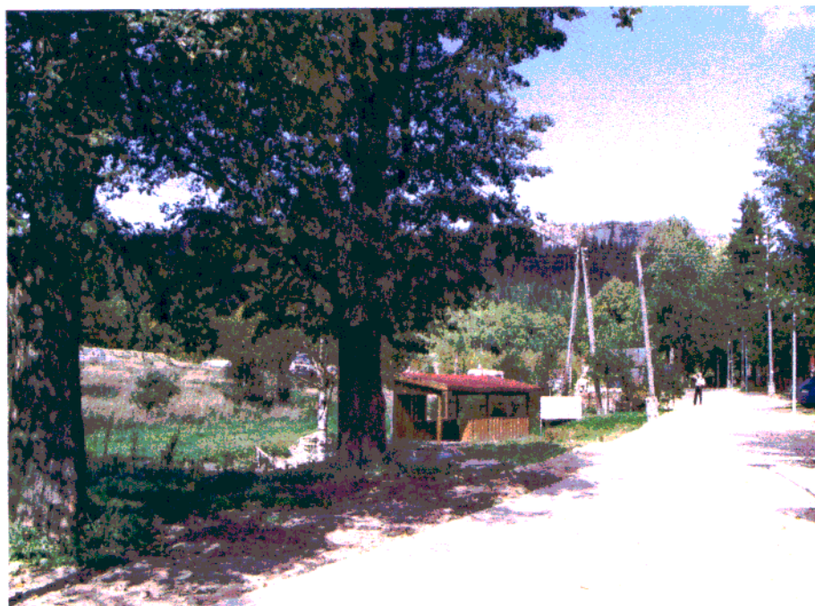
Fot. 5. Szpaler drzew na zachodniej pierzei ciągu.