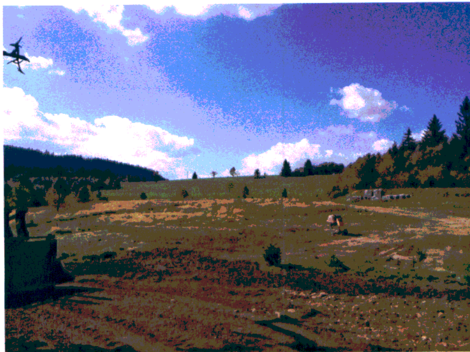
Fot. 4. Otwarcie widokowe na pofałdowaną dolinę w osi południowo-zachodniej w okolicach działki 69