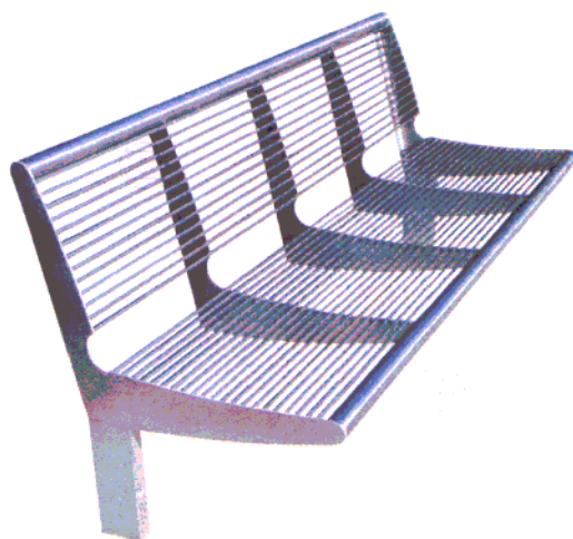
Fot. 10. Proponowana forma ławki w wizualizacji.