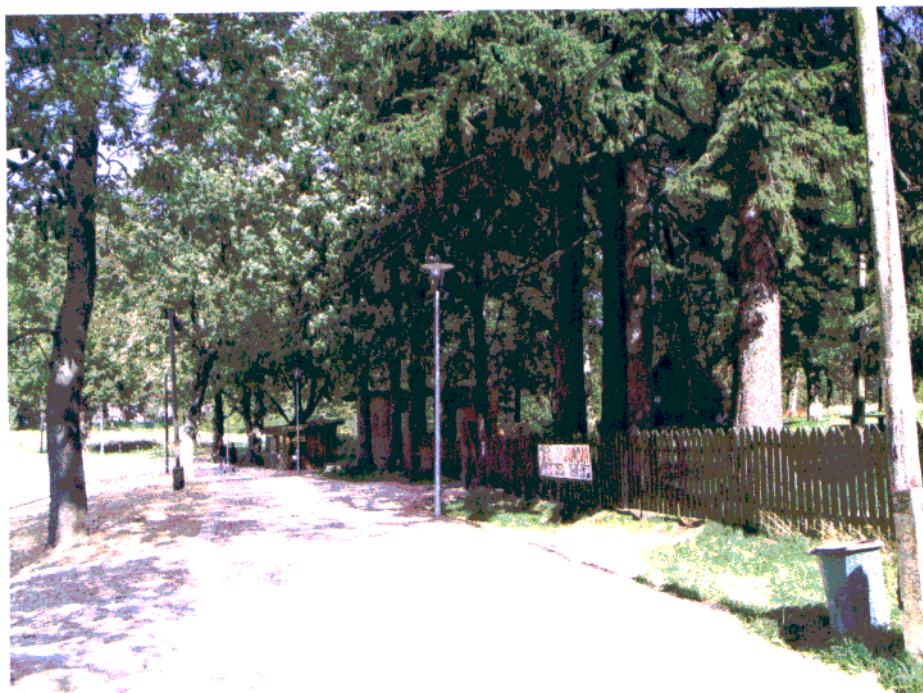
Fot. 6. Zespół zieleni w postaci starodrzewu iglastego na działce 59.